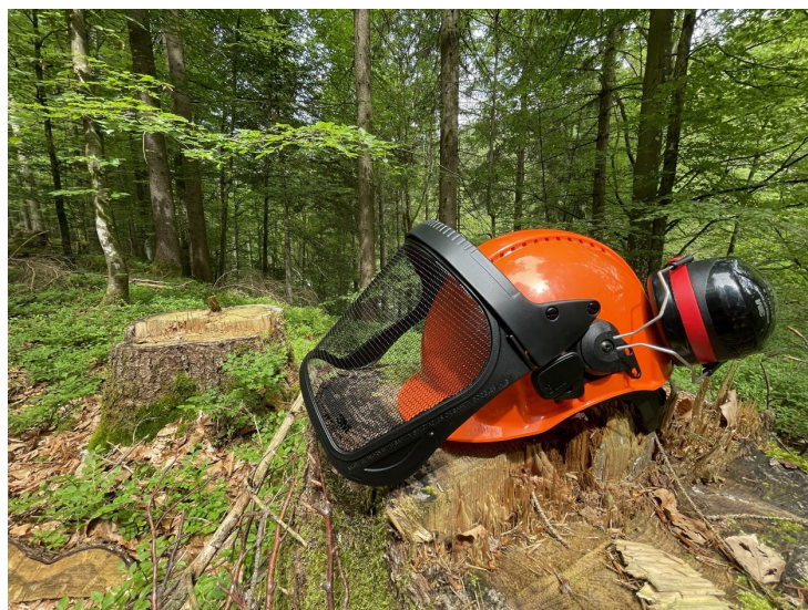
Abbildung 2: Forsthelm

Die UV-Indikatoren, die sich auf einigen Helmen befinden, können nur einen Hinweis geben, dass der Helm früher ausgetauscht werden muss, weil er dem Sonnenlicht überdurchschnittlich ausgesetzt war. Somit sind Helme spätestens nach 5 Jahren auszutauschen, auch dann, wenn der Indikator noch nicht verblasst ist.